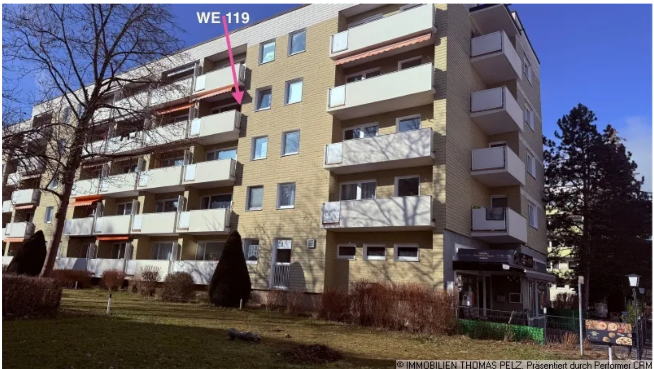
Südansicht WE 119