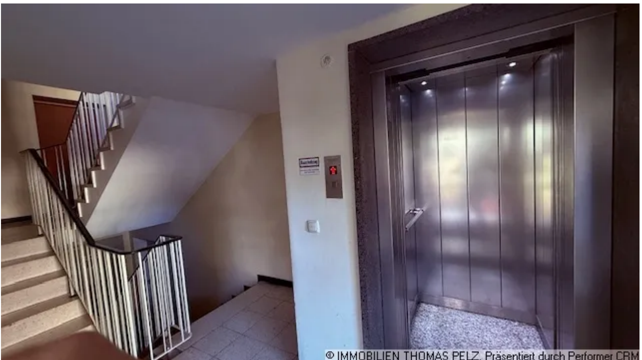
Hausflur mit Aufzug