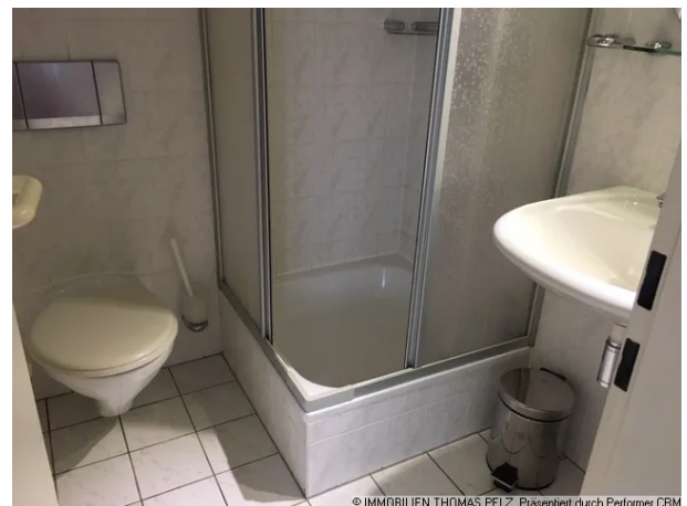
© IMMOBILIEN THOMAS PELZ, Präsentiert durch Performer CRM