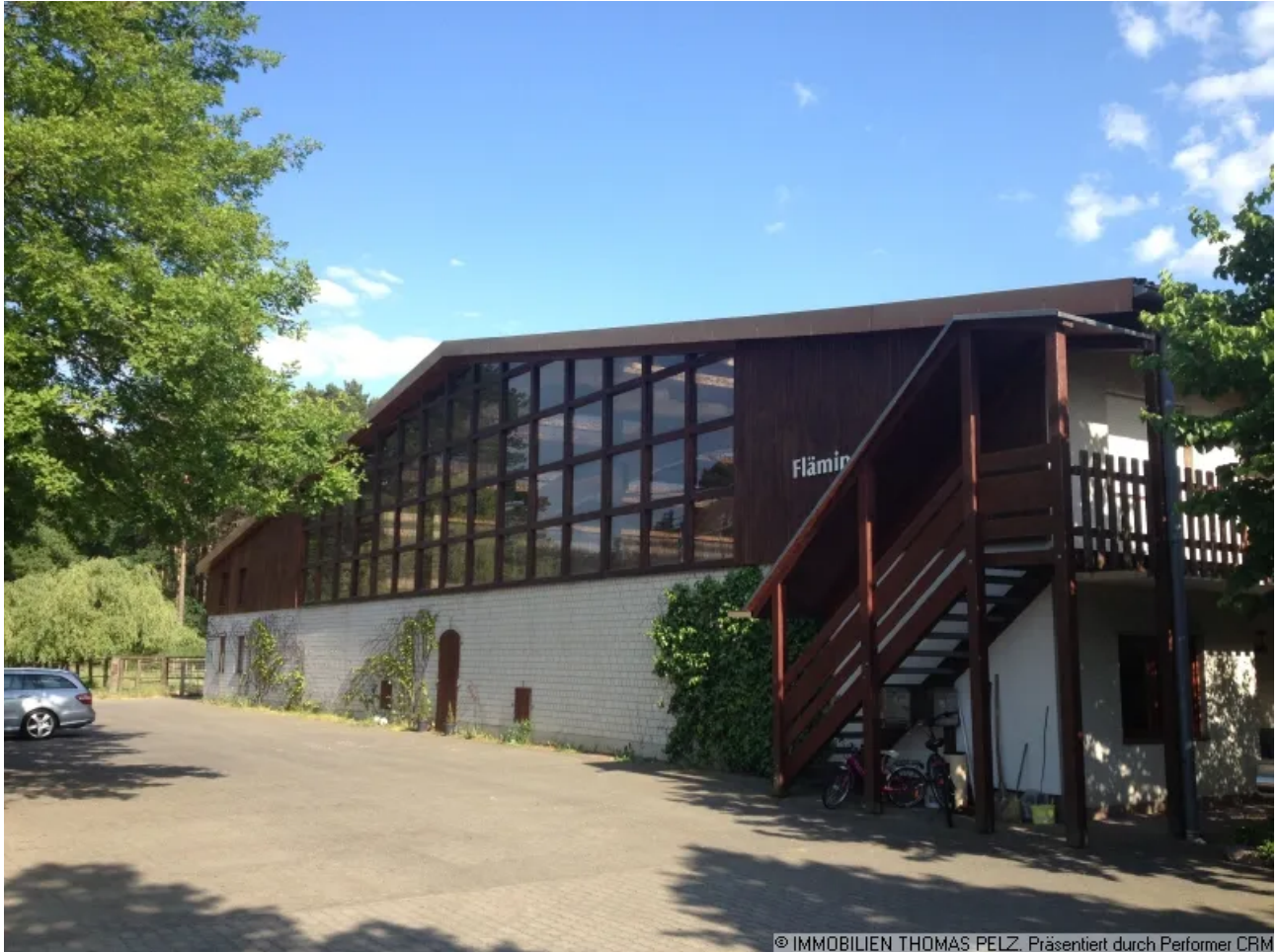
© IMMOBILIEN THOMAS PELZ, Präsentiert durch Performer CRM